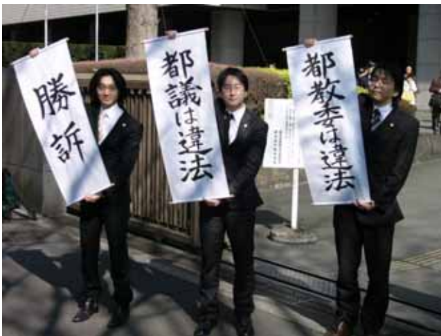
<09.3.12 地裁前で判決報告をする弁護士>