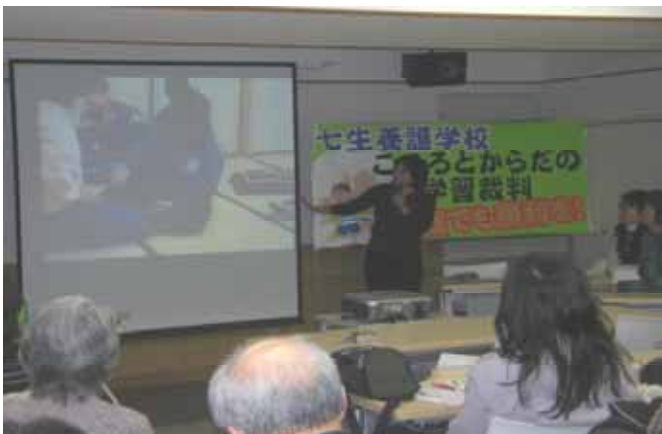
< 10.2.4高裁第3回口頭弁論後の報告集会で >